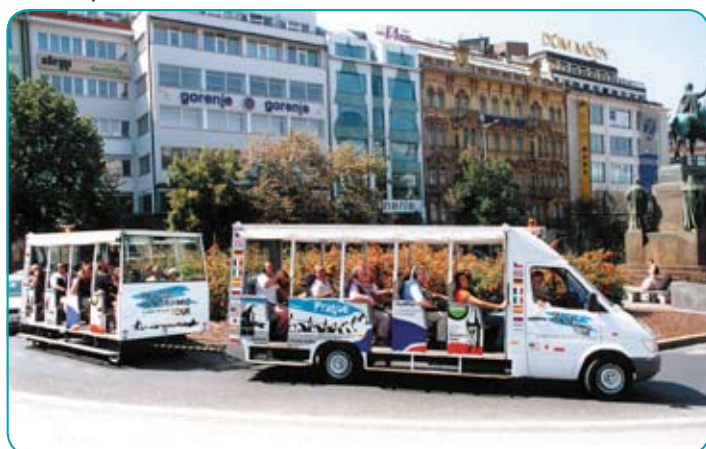
Autobus s přívěsem - Bus mit Anhänger - Bus with Trailer