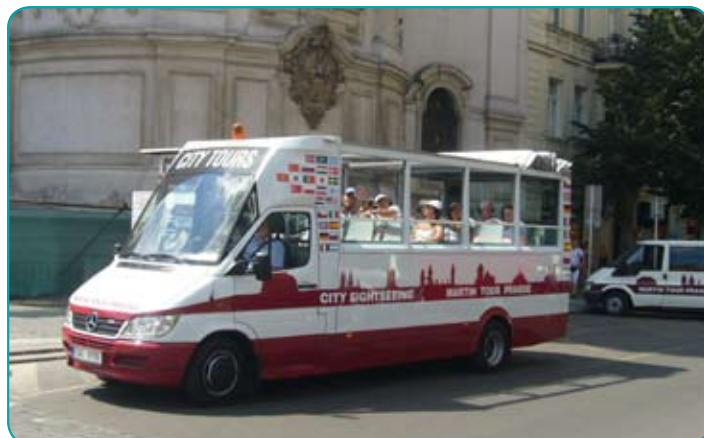
Vyhlídkový autobus se spouštěcími okny a shrnovací střechou