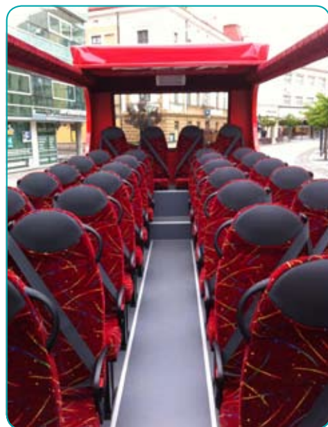
Osvětlení - Beleuchtung - Lighting