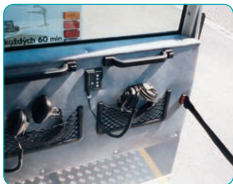
Automatický průvodce Der automatische Begleiter Automatic Tourist Guide