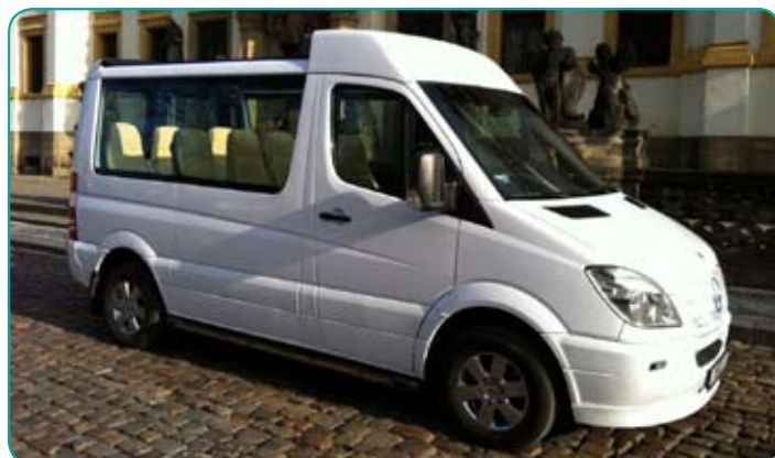
1+8 sedadel - 1+8 Sitze - 1+8 seats, VIP car