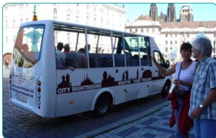
Vyhlídkový autobus - Rundfahrtomnibus - Sightseeing Bus