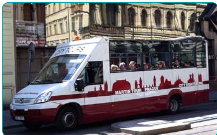
Rundfahrtomnibus mit Fallfenstern und Faltdach