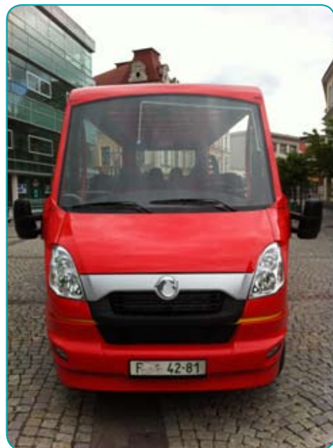
XXL velké čelní sklo XXL - die grosse Frontscheibe XXL - Large Front Window

Výhlídkové autobusy vyrábíme v „letní“ verzi (Summer Bus - vkládaná okna, otevřená/posuvná střecha) nebo ve verzi umožňující celoroční provoz (spouštěcí dvojitě zasklená okna, vytápění a posuvná střecha)