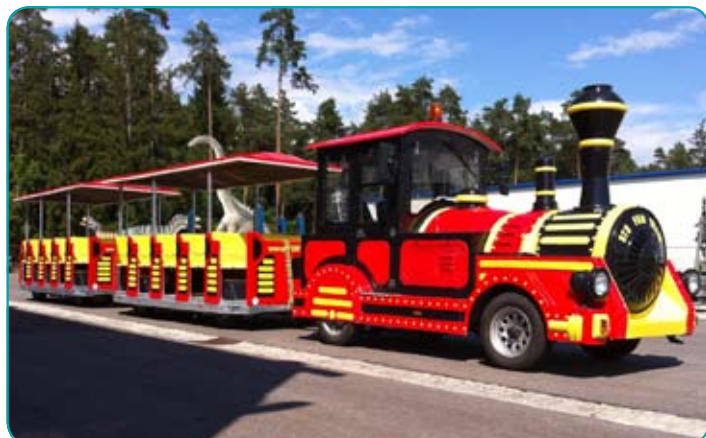
Vyhlídkový silniční vláček - Sightseeing-Zug - Sightseeing train